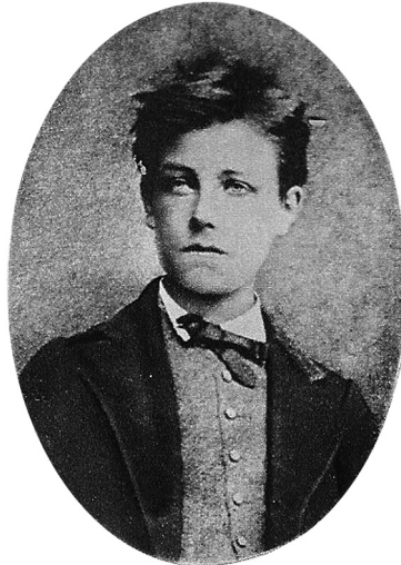
Illustration 2 : Arthur Rimbaud

réalisé par Étienne Carjat (illustration 2), Verlaine évoque par exemple les cheveux « mal en ordre » du poète, son « menton accidenté » et ses lèvres censées exprimer la « protestation 25 ». Les particularités physiques de Rimbaud sont ainsi saisies à travers une sorte de sémantisation maudite. Or Verlaine est loin d'inventer cette posture marginale. Elle s'inscrit au contraire au sein d'une dense « légende pré-écrite 26 ».