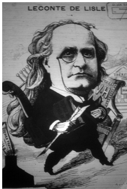
Illustration 1 : Leconte de Lisle

(Gravure de Colignon et Tocqueville Les Hommes d'aujourd'hui , n° 241.)